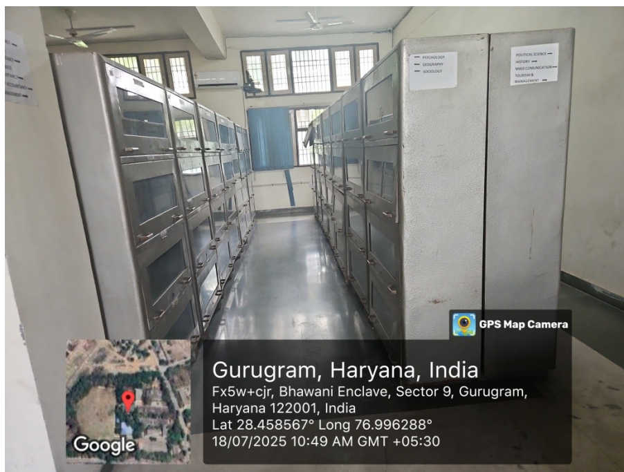
Library Book Selves