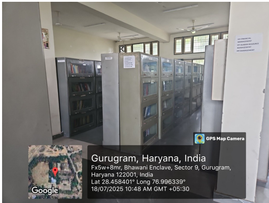
Library Book Selves