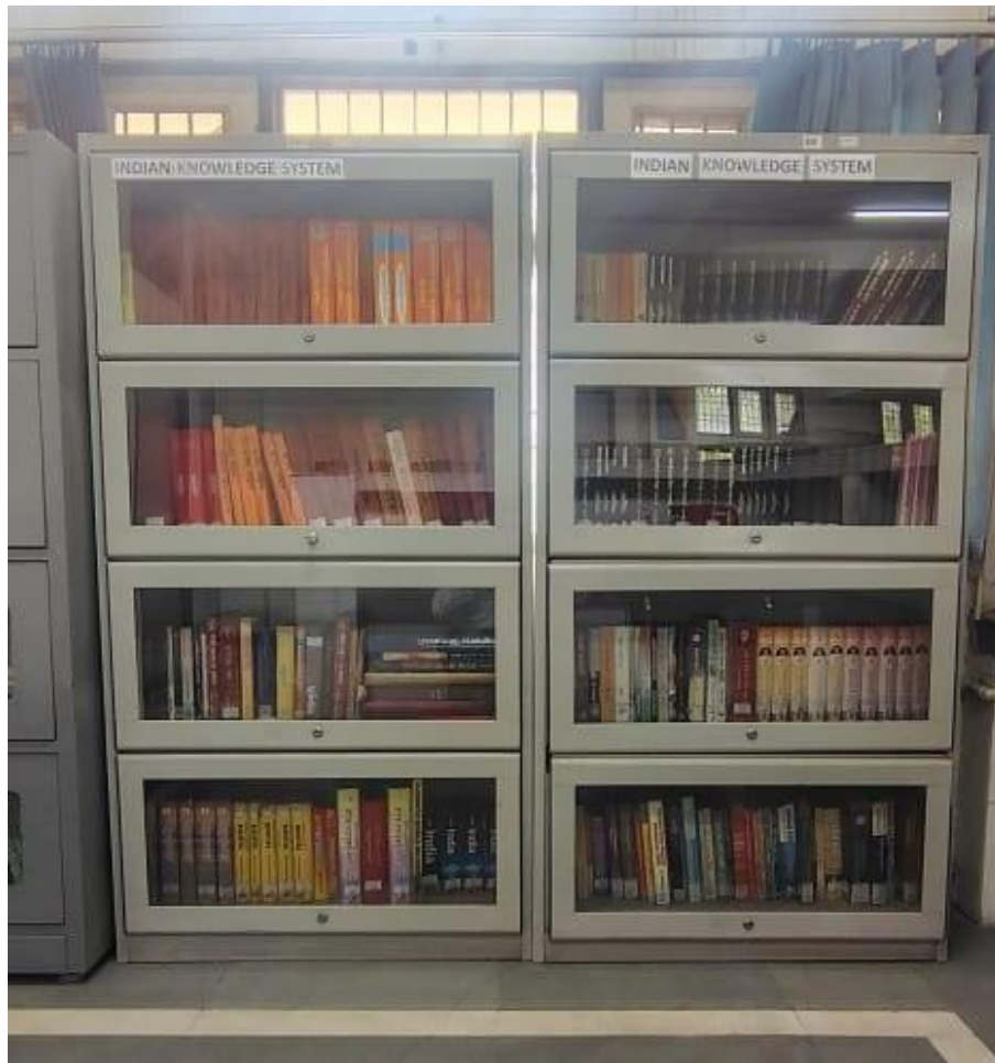
Indian Knowledge System Section