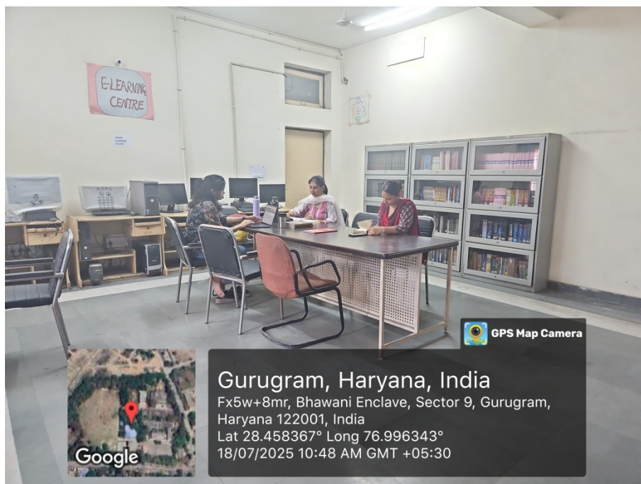
E- Resource Centre