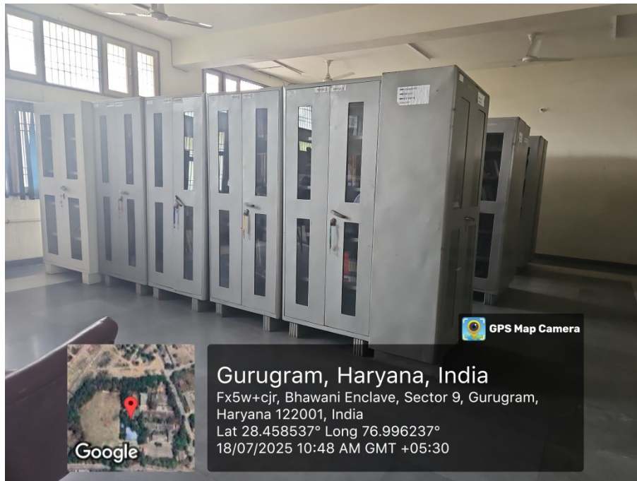
Library Book Selves