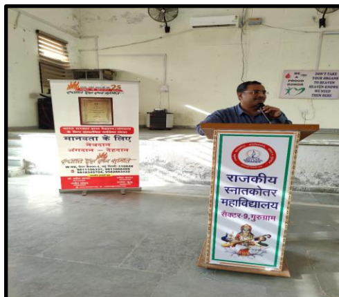
Awareness about organ donation